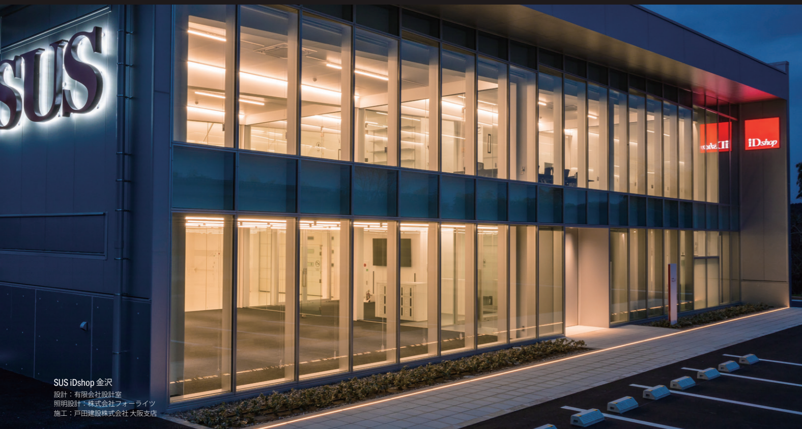
SUS iDshop 金沢 設計：有限会社設計室 照明設計：株式会社フォーライツ 施工：戸田建設株式会社 大阪支店