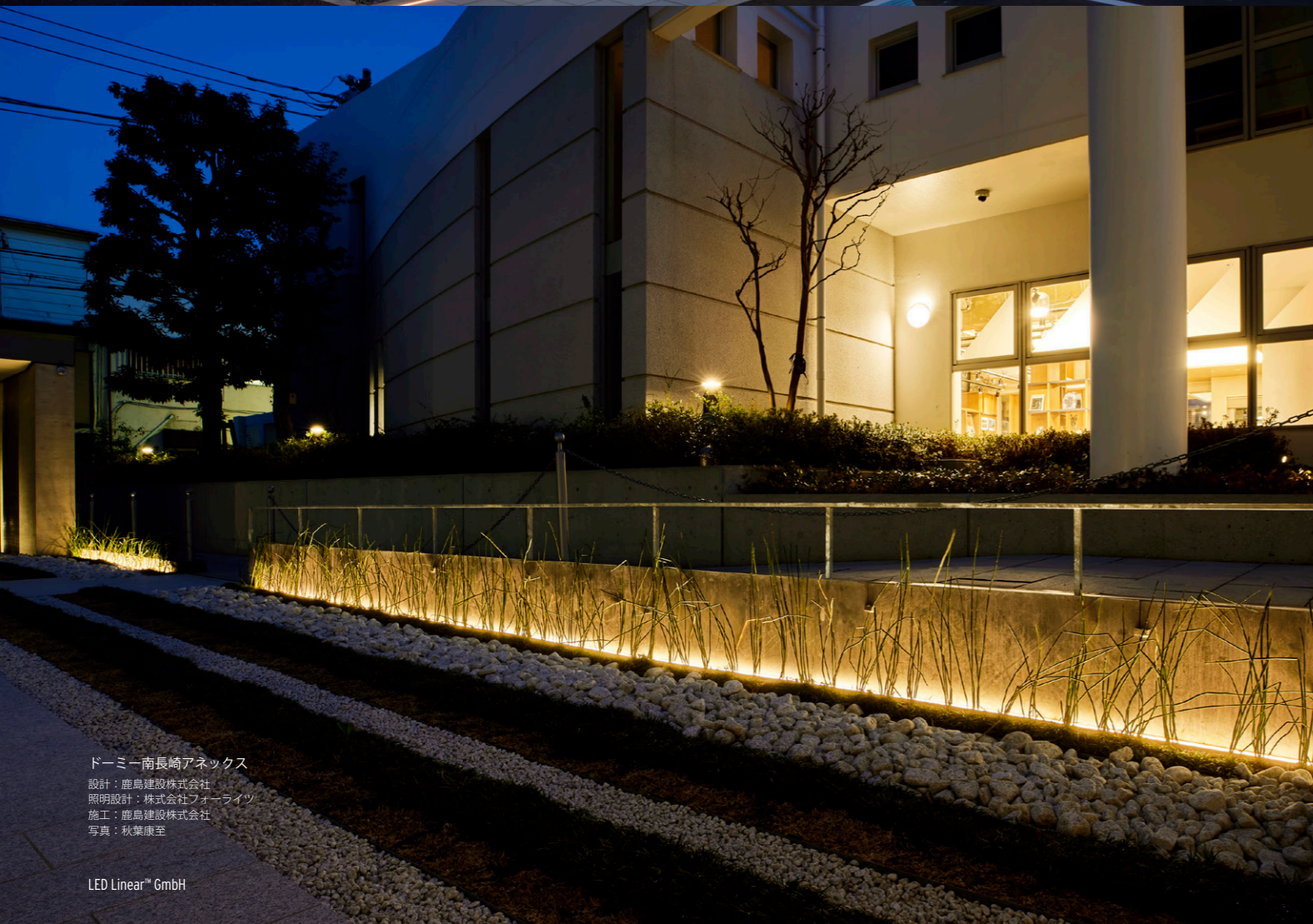
ドーミー南長崎アクセス 設計：鹿島建設株式会社 照明設計：株式会社フォーライツ 施工：鹿島建設株式会社